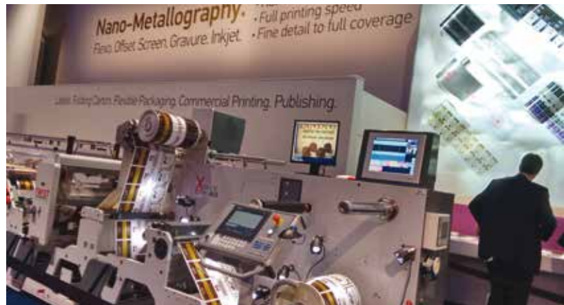
O Grupo Landa™ apresentou a nova impressora para embalagens flexíveis

tintas à base de solvente e à base de água, bem como tinta curada por radiação, tais como UV-LED e EB. Com comprimentos de 400 mm de impressão e 1,200mm de largura até uma largura máxima de 1650 mm, velocidades máximas de até 500mpm e automação, é adequada para várias aplicações no campo de impressão de embalagens flexíveis.