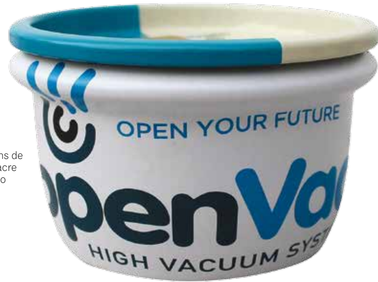
Embalagens de aço com lacre de alumínio